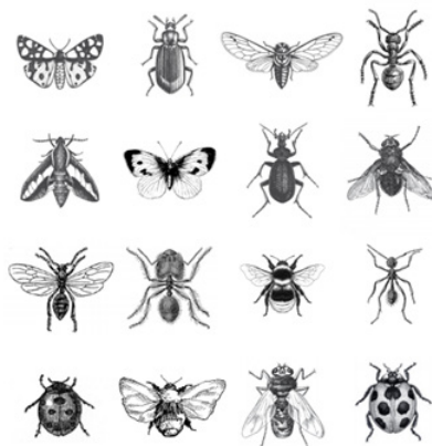
Illustration : nos guides pour planter des haies pour pollinisateurs - POLLINIS

L'hécatombe des insectes pollinisateurs requiert d'agir de façon très concrète : chiffre à peine croyable, au moins 75 % de la biomasse des insectes ailés a déjà disparu en moins de