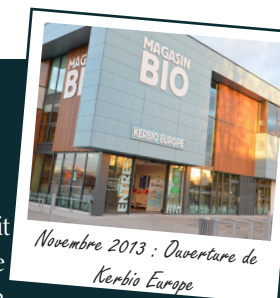
Novembre 2013 : Ouverture de Kerbio Europe

dans ce qui était jusque là une niche. C'est la mise en place de ce que l'on peut constater maintenant : une agriculture biologique à deux vitesses, l'une pour les grandes surfaces, se mettant tout juste au niveau des minimas du cahier des charges bio sans prendre en compte l'esprit de la Bio (Pommes de terre d'Égypte, kiwis de Nouvelle Zélande, tomates en hiver...), et d'autre part une bio équitable, paysanne et durable fidèle aux valeurs de l'exigeant cahier des charges du réseau Biocoop.